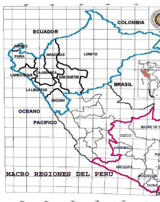
Figura 1.- Macro regiones del Perú

Para tratar sobre el corredor económico Jaén – San Ignacio Condorcanqui, se deben considerar los avances existentes en el proceso de descentralización y regionalización en el que se han presentado diversas opciones, todas ellas con el propósito de aprovechar de la mejor manera las oportunidades presentes con el uso de las potencialidades. En primer lugar se deben considerar las características geográficas y el Corredor Económico Jaén, se encuentra ubicado en el norte peruano y está determinado por el hecho de encontrarse en el espacio intermedio entre las secciones septentrional y central de los Andes; este espacio se caracteriza por que presenta una relativa disminución de su altura en comparación a los andes al sur y al norte; esta característica permite que la costa, sierra, ceja de selva y la selva se acerquen y mantengan comunicación, pero también ocasiona una serie de microclimas y cambios en el clima que determinan que las porciones de puna y sabana esteparia sean más limitadas que en el centro y sur del Perú.