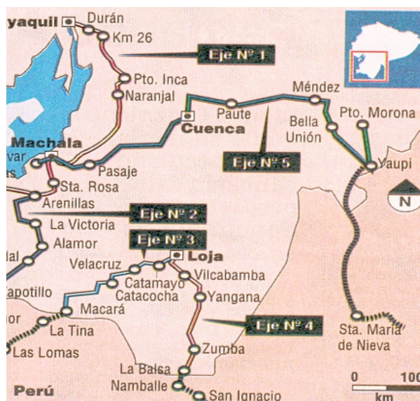
Figura 2 Ejes Viales

El ámbito de estudio se caracteriza porque comparte dos departamentos de la sierra y selva; los que corresponden a las provincias de Jaén y San Ignacio del departamento de Cajamarca, estas provincias se caracterizan por que no tienen conexión directa con su