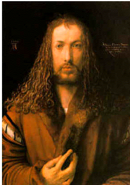
ALBERTO DUREO AUTORRETRATO A LOS 28 AÑOS ÓLEO SOBRE TELA