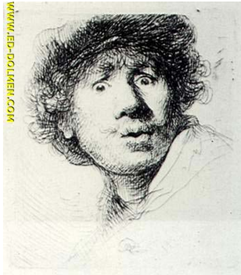
REMBRANDT, 1630 AGUA FUERTE