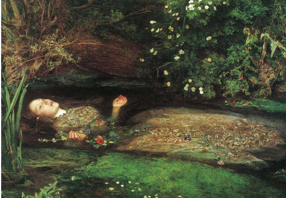
“OFELIA MUERTA” JOHN EVERETT MILLAIS 1852 ÓLEO SOBRE TELA