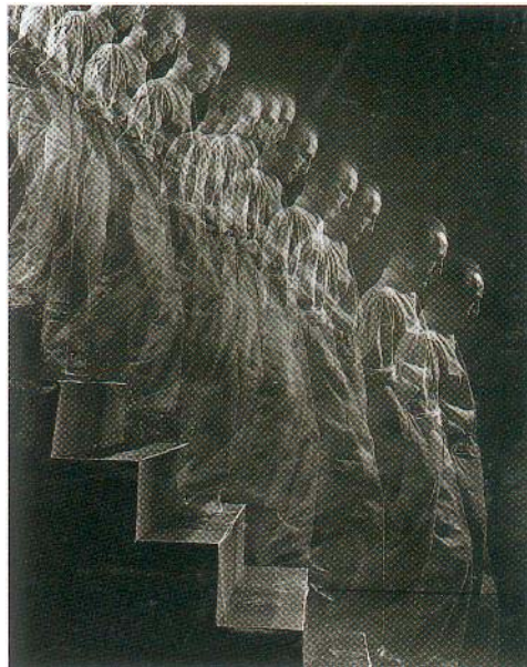
“DUCHAMP BAJANDO LA ESCALERA” FOTGRAFIA N° 284. 1952