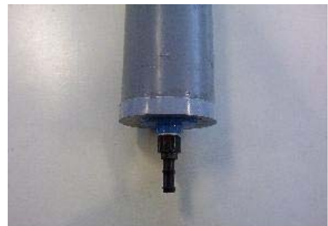
Figura 3. Vista de Descarga inferior.