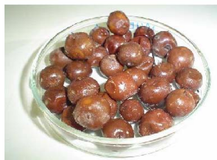
Figura 6. Ensilaje de fruto de Lleuque.