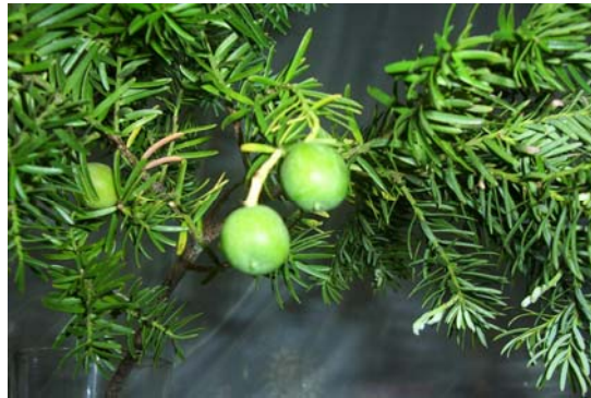
Figura 4. Fruto del Lleuque

Se recolectaron muestras de fruto maduro, en el mes de abril, en el sector de Sahuelhue, en Melipeuco, para ello se llenaron los 4 microsilos con fruto de Lleuque. Además en bolsas de nylon se recolectó una cierta cantidad de fruto para realizar el análisis bromatológico de éste en estado fresco, mientras ocurría el proceso de fermentación en el ensilaje de Lleuque bajo condiciones de laboratorio, por un período de 40 días aproximadamente.