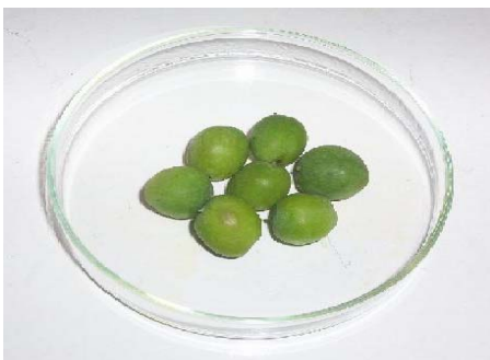
Figura 5. Fruto fresco de Lleuque.

Se realizó en el Laboratorio Bromatológico de la Escuela de Agronomía de la Universidad Católica de Temuco, donde se evaluaron las siguientes variables, tanto del fruto fresco como ensilado: Materia Seca (parcial y total), Cenizas, Proteína Cruda, Extracto Etéreo, Fibra Cruda, Fibra Detergente Neutro, Fibra Detergente Ácido, Fósforo, Carbohidratos y pH, además Nitrógeno Amoniacal sólo en ensilaje, por medio del Análisis Proximal o de Weende y Análisis de la composición Celular o de Van Soest.