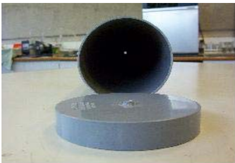
Figura 2. Vista de Carga superior.