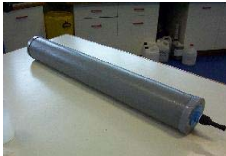
Figura 1. Vista lateral de microsilo.

A continuación se muestran algunas fotografías de los microsilos, tomadas de diferentes ángulos, para obtener una apreciación más clara de su elaboración.